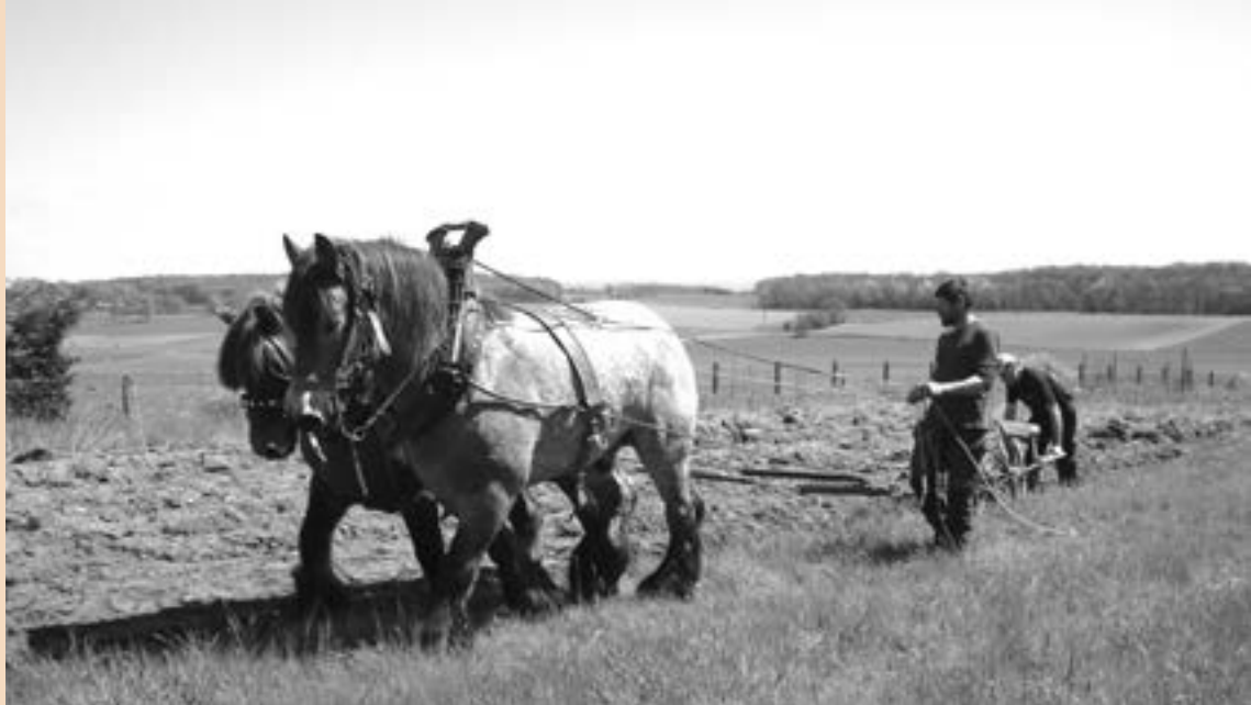
Préparation « à l'ancienne » du potager, lors du projet nature.

élèves sont les «contrats d'apprentissage personnalisé» (CAP). «L'élève peut proposer à son professeur de voir la matière à sa façon.» Il doit donc rester entre les murs de l'école, mais n'est pas obligé d'être au cours. En théorie, il est censé se pencher sur la matière, de son côté, à son rythme.