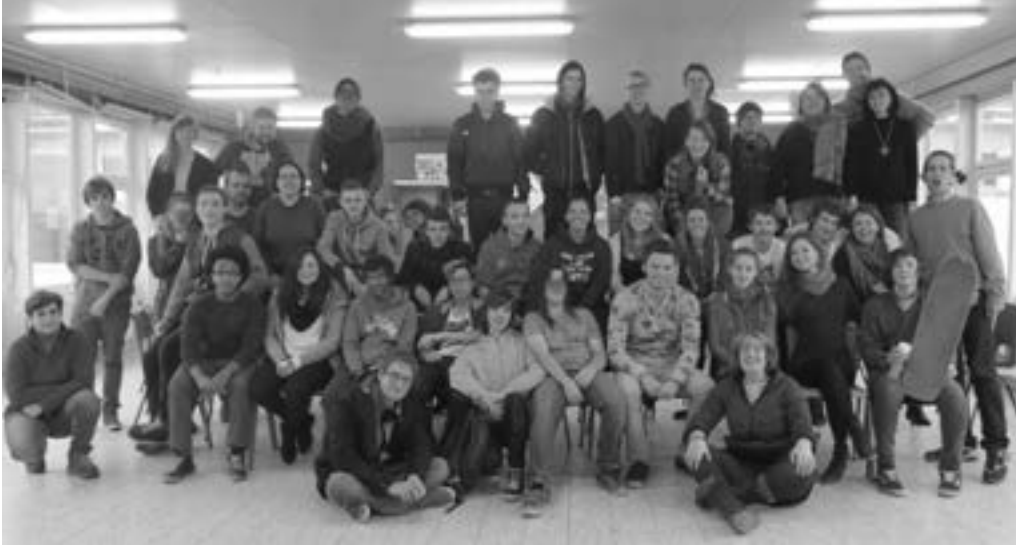
Le groupe au complet, élèves et professeurs réunis.

un livre, avec nos travaux d'écriture», affirme-t-elle, enthousiaste.